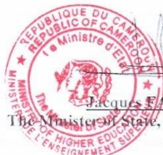
Jacques FAME NDONGO, The Minister of State, Minister of Higher Education

Article 8: The Rector of the University of Ngaoundere, the Director of University Accreditations and Quality of the Ministry of Higher Education and the Director of ENSAI are responsible for the execution of this decision.